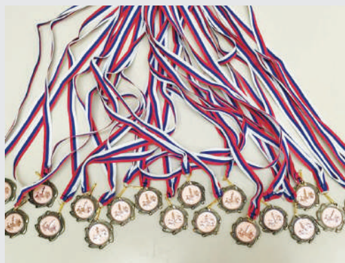
Medalja za vsakega udeleženca šolskega prvenstva

Priporočeno je tudi, da vsak učenec odide s turnirja z medaljo (najboljši trije z medaljo za 1., 2. in 3. mesto, ostali pa z medaljo za odigrano prvenstvo).