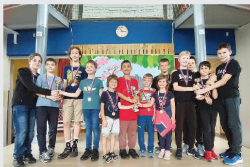
Najboljše tri ekipe dečkov na Osnovnošolskem ekipnem državnem prvenstvu

Dečki: 1. mesto OŠ Breg, 2. mesto OŠ bratov Polančičev Maribor, 3. mesto OŠ Janka Modra Dol pri Ljubljani.