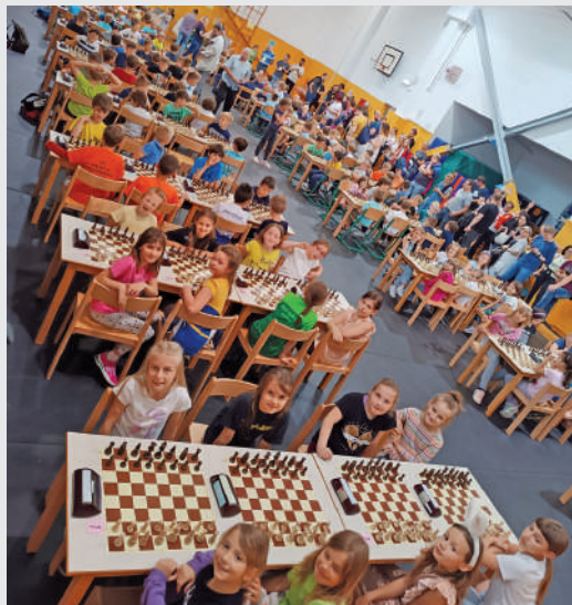
Osnovnošolsko državno prvenstvo

nji Slovenske Konjice, 3. mesto DOŠ I Lendava.