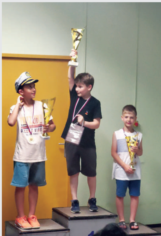
Najboljše tri pri dekletih U9 in najboljši trije pri fantih U9