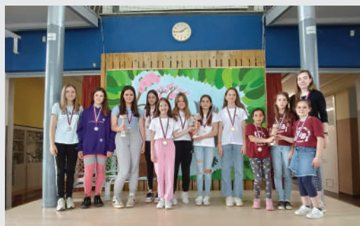
Najboljše tri ekipe deklic na Osnovnošolskem ekipnem državnem prvenstvu

Deklice: 1. mesto OŠ Bogojina, 2. mesto OŠ Ob Rinži Kočevje, 3. mesto OŠ Bojana Iliča Maribor.