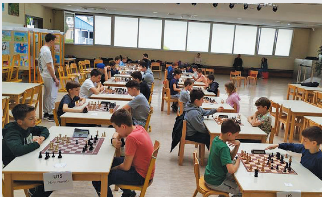
Zaključek šahovskega krožka – prvenstvo OŠ Jakoba Aljaža Kranj

ali so figure na šahovnici pravilno postavljene in ali šahovska ura dobro deluje. Pomembno jih je tudi opozoriti, da v partije drugih ne smejo posegati (to je najlažje doseči tako, da ob mizah ni drugih učencev (niti staršev) in da partije gledajo bolj od daleč). Če ne morete za turnir dobiti nikogar, ki zna soditi ali ima vsaj veliko izkušenj s turnirji (morda kakšen od starejših učencev, ki obiskuje šahovski klub in se je pripravljen odpovedati igranju na šolskem turnirju), je priporočljivo prebrati priročnik za šahovske sodnike ali se vsaj s kom pogovoriti o reševanju najpogostejših situacij na