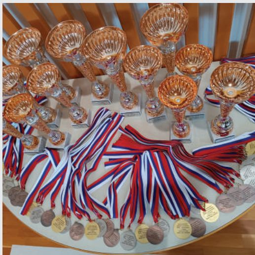
Pokali in medalje osnovnošolskega državnega prvenstva do 9 let