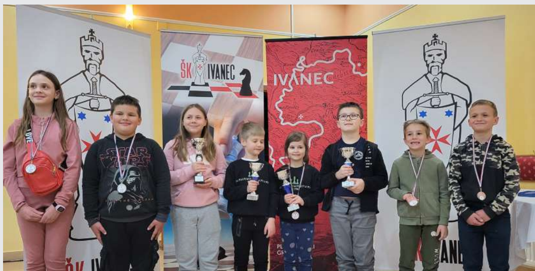
Na fotografiji: kadetska liga Spodnjega Podravja

Odločitev vodstva Šahovskega društva Ptuj, da uvede kadetsko ligo Spodnjega Podravja, je bila pravilna, saj je na prvih treh turnirjih nastopilo 69 šahistk in šahistov (52 fantov in 17 deklet). Največ, kar 48, jih je bilo na drugem turnirju, vedno pa je najmočnejša udeležba v konkurenci do 12 let. Vsekakor veseli dejstvo, da se za šah zanima vse več pripadnic nežnejšega spola.